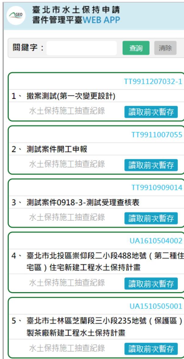
圖 7：個人案件管理列表

成功登入後，即進入個人案件管理列表頁面中，提供使用者所負責之各案件「水土保持施工抽查紀錄」，並提供關鍵字查詢功能，以便使用者快速查找欲填登抽查紀錄的案件。